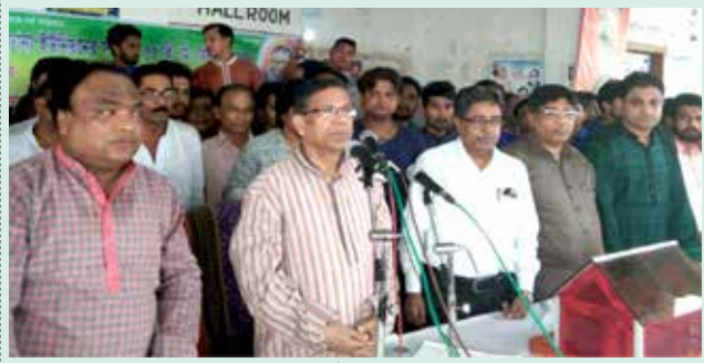
নতুন বিদ্যুৎ সংযোগের উদ্বোধনী অনুষ্ঠানে বক্তব্য রাখছেন আইন, বিচার ও সংসদ বিষয়ক মন্ত্রণালয়ের মাননীয় মন্ত্রী এডভোকেট মোঃ আনিসুল হক এমপি।