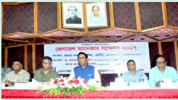
জেনারেল ম্যানেজার সম্মেলন-২০১৭ প্রধান অতিথি হিসেবে উপস্থিত ছিলেন বিদ্যুৎ, জ্বালানি ও খনিজ সম্পদ মন্ত্রণালয়ের মাননীয় প্রতিমন্ত্রী মোঃ নসরুল হামিদ, এমপি