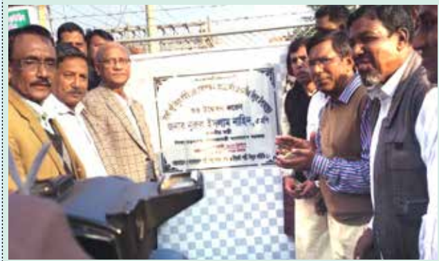
গোলাপগঞ্জ-২ ৩৩/১১ কেভি বিদ্যুৎ উপকেন্দ্রের শুভ উদ্বোধন করছেন মাননীয় শিক্ষামন্ত্রী নুরুল ইসলাম নাহিদ, এমপি।

সিলেট পবিস-১ এর আওতাধীন বিদ্যুৎ উপকেন্দ্র শুভ উদ্বোধন গত ১৫ ফেব্রুয়ারি ২০১৭ খ্রিঃ সিলেট পল্লী বিদ্যুৎ সমিতি-১ এর উদ্যোগে গোলাপগঞ্জ-২ ৩৩/১১ কেভি বিদ্যুৎ উপকেন্দ্রের শুভ উদ্বোধন করা হয়। উদ্বোধনী অনুষ্ঠানে প্রধান অতিথি হিসেবে উপস্থিত ছিলেন গণপ্রজাতন্ত্রী বাংলাদেশ সরকারের মাননীয় শিক্ষামন্ত্রী নুরুল ইসলাম নাহিদ, এমপি। এ সময় প্রধান অতিথি সমিতির কার্যক্রমে সন্তোষ প্রকাশ করেন এবং সমিতির সকল পর্যায়ের কর্মকর্তা ও কর্মচারীদের প্রতি ধন্যবাদ জ্ঞাপন করেন।