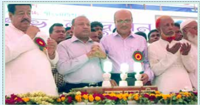
সুইচ টিপে বিদ্যুৎ সংযোগের শুভ উদ্বোধন করেন মাননীয় সংসদ সদস্য।

গত ২৬ মে কুমিল্লা জেলার লাকসাম উপজেলার আজগরা ইউনিয়নের বড়বাম গ্রামে বিদ্যুতায়ন অনুষ্ঠানের শুভ উদ্বোধন করেন মাননীয় সংসদ সদস্য ও বিদ্যুৎ জ্বালানী ও খনিজ সম্পদ মন্ত্রণালয় সম্পর্কিত সংসদীয় স্থায়ী কমিটির সভাপতি মোঃ তাজুল ইসলাম। এ সময় সংসদ সদস্য এর