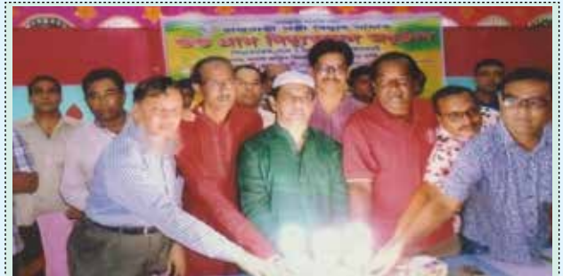
সুইচ টিপে বিদ্যুৎ সংযোগের উদ্বোধন করেন রাজবাড়ী-১ আসনের মাননীয় সংসদ সদস্য আলহাজ্ব কাজী কেরামত আলী