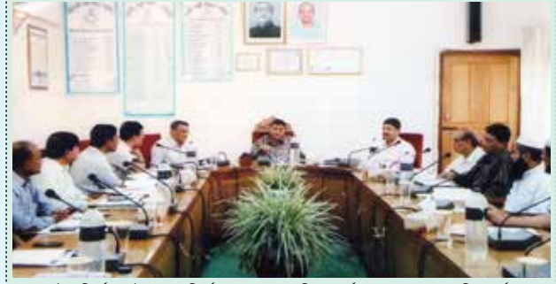
লাইন নির্মাণ ও উপকেন্দ্র নির্মাণ কাজের অগ্রগতি ও পর্যালোচনা সভায় বাপবিবোর্ডের চেয়ারম্যান মহোদয়ের মত বিনিময়।

গতিশীলতা বৃদ্ধি করা এবং উত্তম গ্রাহক সেবা অব্যাহত রাখার নির্দেশনা প্রদান করেন। পরিশেষে সকলকে ধন্যবাদ জানিয়ে সভার সমাপ্তি ঘোষণা করা হয়।