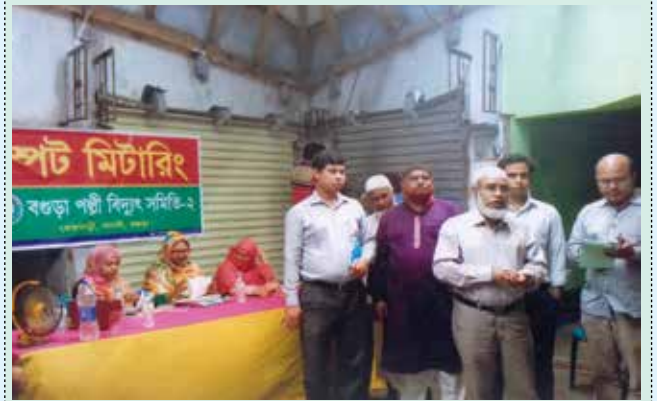
বগুড়া পবিস-২ এর আওতাধীন শাহাজানপুর উপজেলার অন্তর্গত আতাইল বাজারে বাণিজ্যিক গ্রাহকের বিদ্যুৎ ব্যবহার বৃদ্ধিকরণ ও পার্শ্ব সংযোজন পরিহার করে গত ২৯/০৭/২০১৭ তারিখ স্পট মিটারিং করা হয়।

বগুড়া পবিস-২ এর আওতাভুক্ত শাহাজানপুর উপজেলার আতাইল নামক বাজারে গত ২৯ জুলাই পার্শ্ব সংযোগ বিচ্ছিন্ন করে ট্রান্সফরমার পরিবর্তন করে স্পট মিটারিং এর মাধ্যমে ১টি মসজিদসহ ৩৯টি বাণিজ্যিক গ্রাহককে বিদ্যুৎ সংযোগ প্রদান করা হয়। এতে গ্রাহকের মাঝে ব্যাপক উৎসাহ উদ্দীপনা লক্ষ্য করা যায় এবং জনগণের মাঝে ব্যাপক আলোড়ন সৃষ্টি হয়। স্পট মিটারিং কার্যক্রম চলাকালিন সময়ে সমিতির জেনারেল ম্যানেজার উপস্থিত সকল গ্রাহকের উদ্দেশ্যে বক্তব্য প্রদান করেন। জেনারেল ম্যানেজার তার বক্তব্য বলেন, 'শেখ হাসিনার উদ্যোগ-ঘরে ঘরে বিদ্যুৎ' এই স্লোগান সামনে রেখে সরকার ২০১৮ সালের মধ্যে শতভাগ উপজেলা বিদ্যুতায়নের পরিকল্পনা গ্রহণ করেছে।